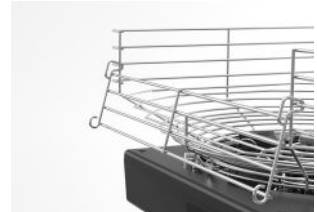
Cesta con puerta abatible

Cesta con puerta abatible que facilita la carga de frutas. Su característica doble posición permite colocar la puerta tanto en la parte frontal como en la parte trasera en función de las necesidades concretas de cada establecimiento.