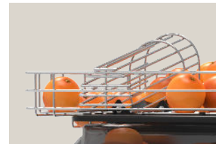
Sensor contact de serie

La máquina entra en funcionamiento automáticamente cuando el sensor Contact, incorporado de serie, detecta naranjas en la rampa. Se detendrá también de forma automática cuando no haya naranjas en la rampa, quedando el exprimidor en modo stand by.