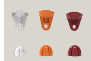
Kits de exprimido

Pequeño (S): Gris; Mediano (M): Naranja; Grande (L): Granate.