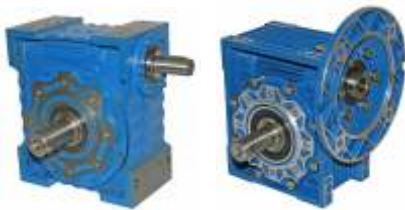
Tabla de Datos (Motor 4 polos, 1800 rpm)